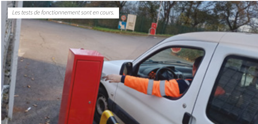
Les tests de fonctionnement sont en cours.

Au début de l'année prochaine, l'entrée des deux déchetteries du Val de Sarthe à Guécélard et à Roëzé-sur-Sarthe sera réservée aux ressortissants du territoire. Les conditions de fonctionnement définitives seront déterminées à l'issue de plusieurs mois de test. Explications.