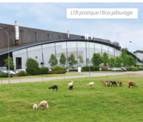
LTR pratique l'écopâturage.

* Propriété d'un groupe privé indonésien, SWM International compte également six autres usines de production de papiers spécifiques (industriels, tabac, packaging) implantées à Quimperlé, dans l'Ariège, en Pologne, aux États-Unis (2) et au Brésil.