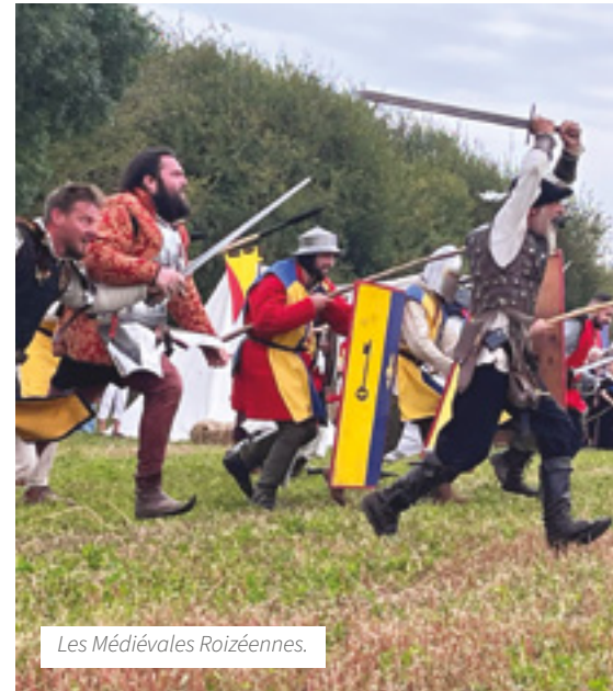
Les Médiévales Roëzéennes.