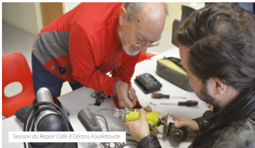
Session du Repair Café à Cérans-Fouletourte.