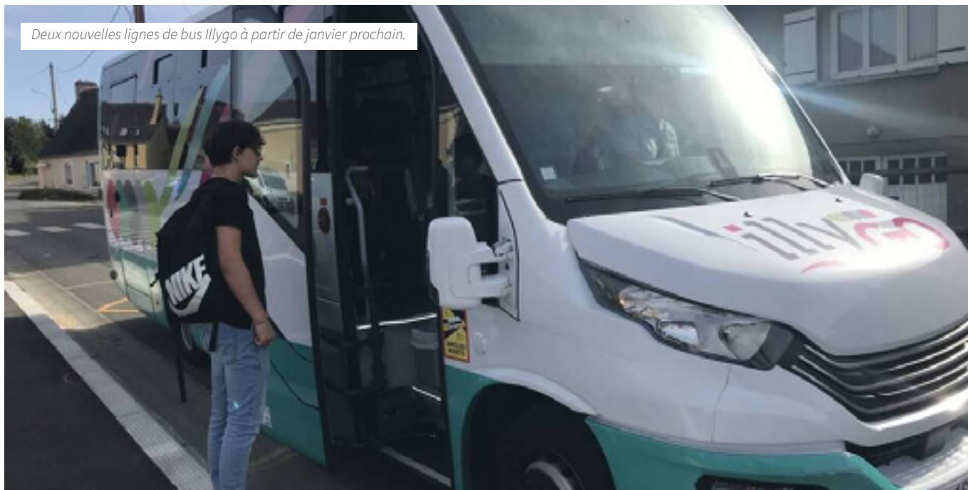
Deux nouvelles lignes de bus Illygo à partir de janvier prochain.

À compter du 2 janvier 2025, deux nouvelles lignes de bus Illygo desserviront plusieurs Communes du Val de Sarthe et des zones d'activités économique. Un déploiement expérimental qui pourra répondre aux besoins des actifs locaux.