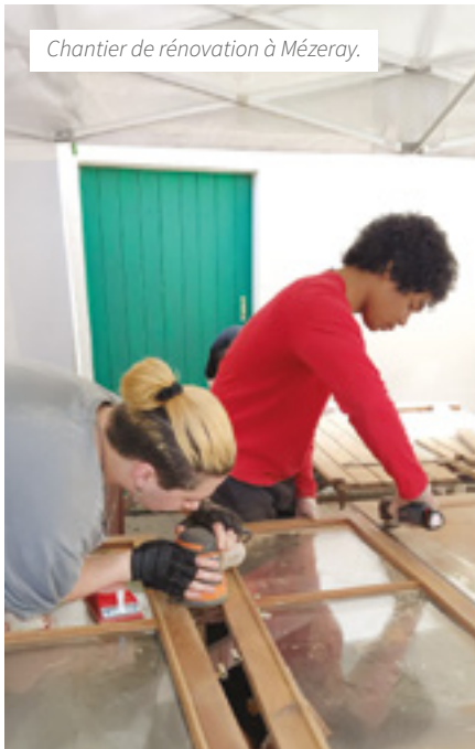
Chantier de rénovation à Mézeray.

* Le dispositif intervient aussi dans d'autres intercommunalités : Le Mans Métropole, L'Orée de Bercé - Belinois, le Sud-Est Manceau et Maine Cœur de Sarthe.