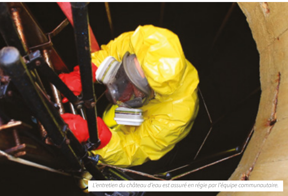
L'entretien du château d'eau est assuré en régie par l'équipe communautaire.

Comme chaque année, le service cycle de l'eau de la Communauté de communes du Val de Sarthe procède au grand nettoyage du château d'eau et des deux réservoirs de La Suze-sur-Sarthe. Zoom et explications sur l'importance de cette intervention.