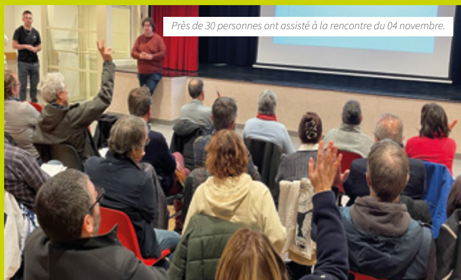
Près de 30 personnes ont assisté à la rencontre du 04 novembre.

écologique et économique, tant en matière de placement financier que de création d'emplois locaux. Autres retombées chères à la Communauté de communes du Val de Sarthe : « ce type de projet permet de voir émerger de nouvelles formes de coopération citoyenne, de favoriser les rencontres et des initiatives locales impliquées dans la transition énergétique du territoire » confie le Président Emmanuel Franco. Le Pays Vallée de la Sarthe, qui s'est associé à cette action dans le cadre du PCAET (Plan climat air énergie territorial) et du Plan paysage, voit dans cette démarche innovante « l'opportunité de faire rayonner de bonnes idées, de voir des initiatives citoyennes locales se développer et permettre au territoire de se réapproprié un bien commun : l'énergie » ajoute sa directrice, Céline Bihel.